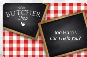
Badge per dipendenti

Aumentate la redditività del vostro investimento stampando tutti i badge e le tessere necessari per la vostra attività. Con le soluzioni Edikio Price Tag Flex e Duplex, realizzate delle stampe a colori su tessere bianche in formato carta di credito: