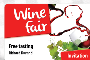
Inviti agli eventi